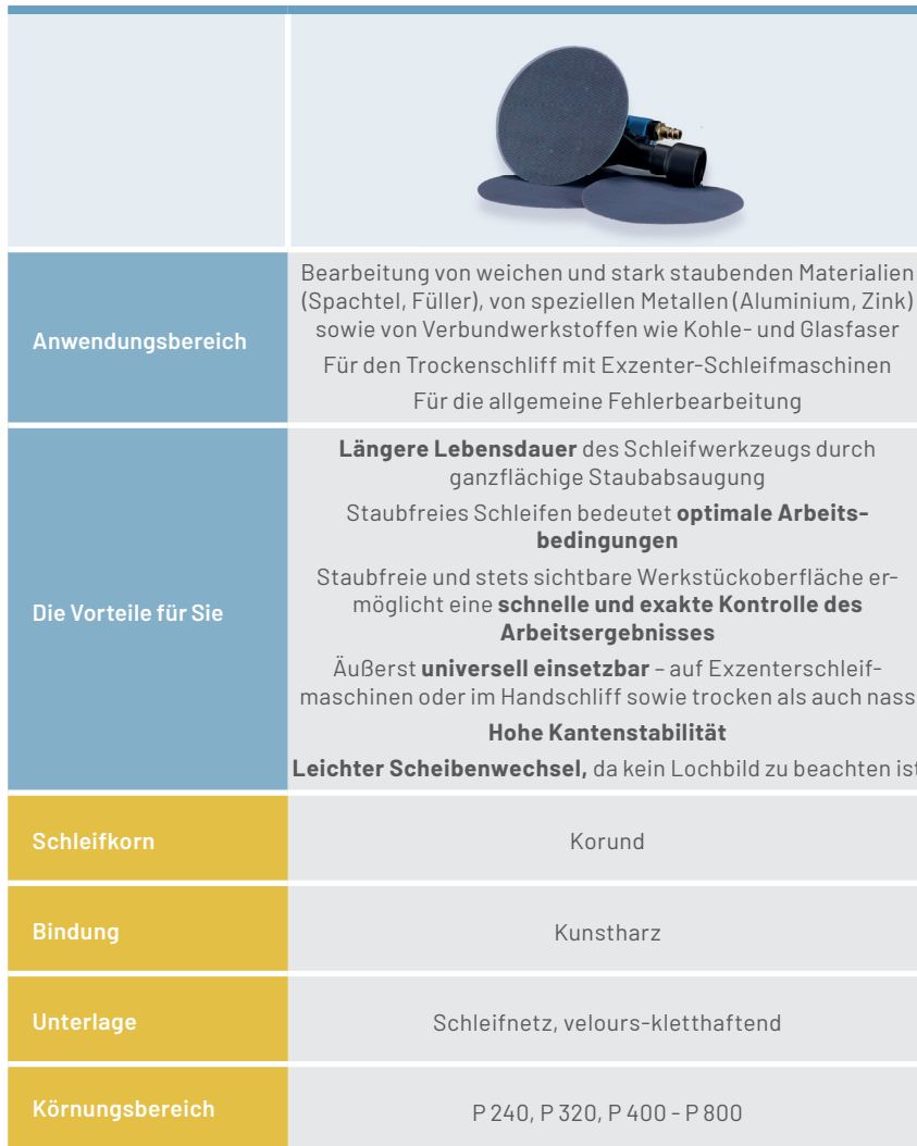
MULTINET MN 921 VEL