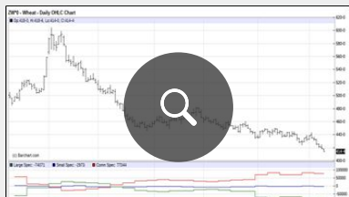
Position des fonds américains