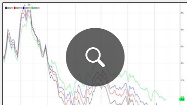
Evolution des contrats maïs

"Les plants y ont besoin de pluies à court terme afin de faire grossir et mûrir les épis dans de bonnes conditions mais les prévisions météorologiques anticipent surtout un temps sec dans les principales zones de production", note-t-il. "Des pertes sont de plus en plus probables, alors même que la récolte en Argentine a déjà pâti de pertes importantes en début d'année", ajoute le spécialiste. Selon Buenos Aires Exchange, au 18 avril la production de maïs est toujours estimée à 32 Mt soit 7 Mt de moins que la dernière récolte. Quant au maïs, il est noté à 77 % en conditions « pauvre à très pauvre » avec 86 % des surfaces en déficit hydrique. Les récoltes sont achevées à hauteur de 30 % des surfaces semées au 18 avril. Le gouvernement argentin estime que la production sera en baisse de près de 20 Mt par rapport à l'an dernier à 38 Mt.