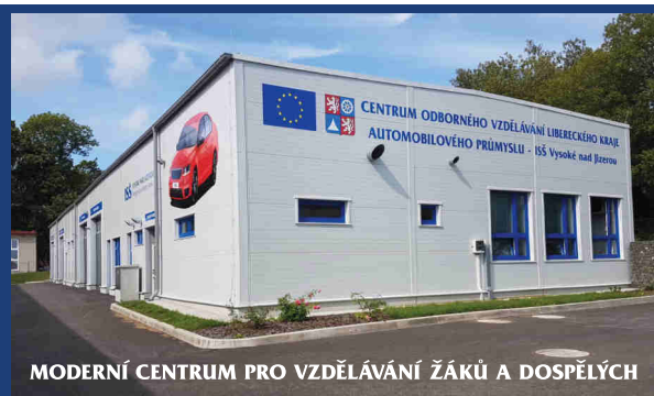
MODERNÍ CENTRUM PRO VZDĚLÁVÁNÍ ŽÁKŮ A DOSPĚLÝCH