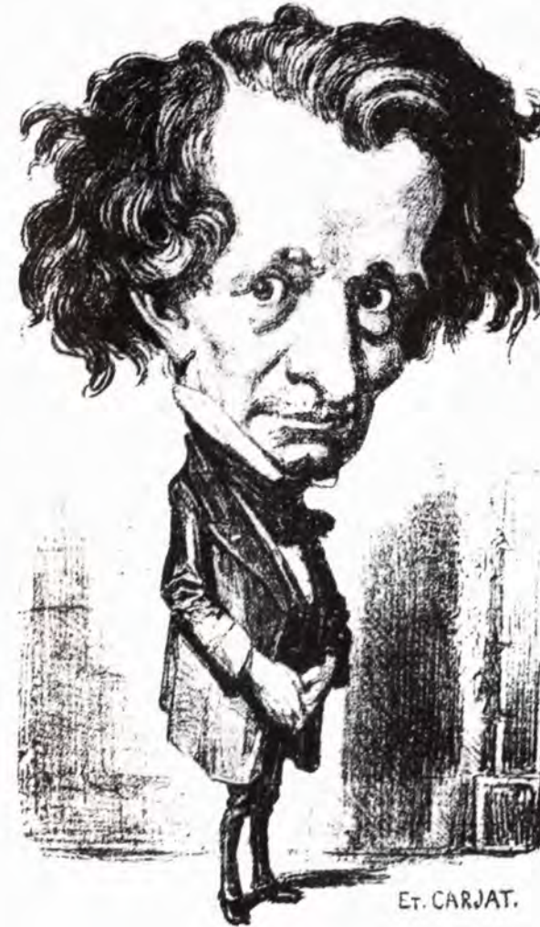
Hector Berlioz, karikatuur door E. Carjat.

De Finale (Presto) toont Schumann op zijn driftigst en zijn origineelst. Tot bij de uitgesponnen ontwikkeling zou men zich haast bij Haydn wanen, ware het niet dat Schumann plots voor een verrassing zorgt: een kort Moderato met nieuwe ideeën, gevolgd door een reeks mysterieuze pianissimo akkoorden. De beweging wordt tenslotte afgerond door een onweerstaanbaar vrolijke coda.