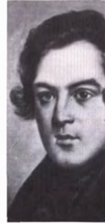
ROBERT SCHUMANN 1810-1856