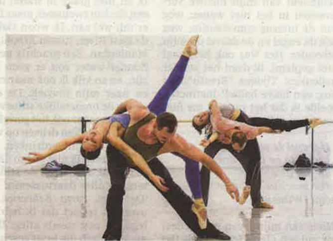
De repetities voor ‘Van Manen/Cherkaoui’.