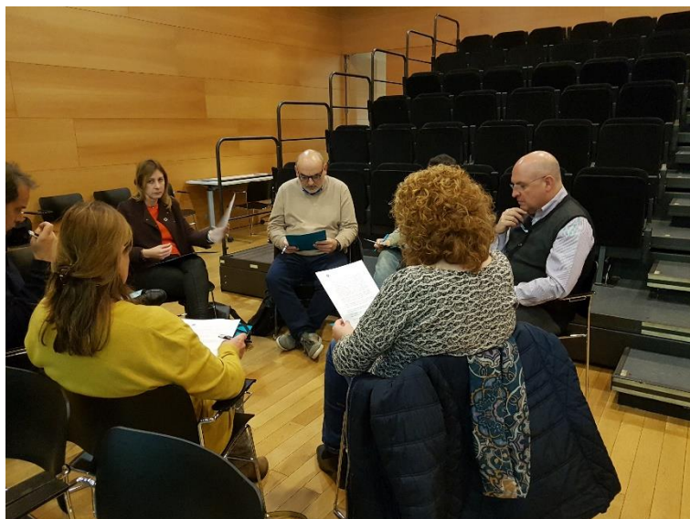
Un dels tres treballs en grup per fer aportacions a la proposta de Declaració d'Emergència Climàtica.