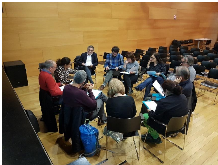
Un dels tres treballs en grup per fer aportacions a la proposta de Declaració d'Emergència Climàtica