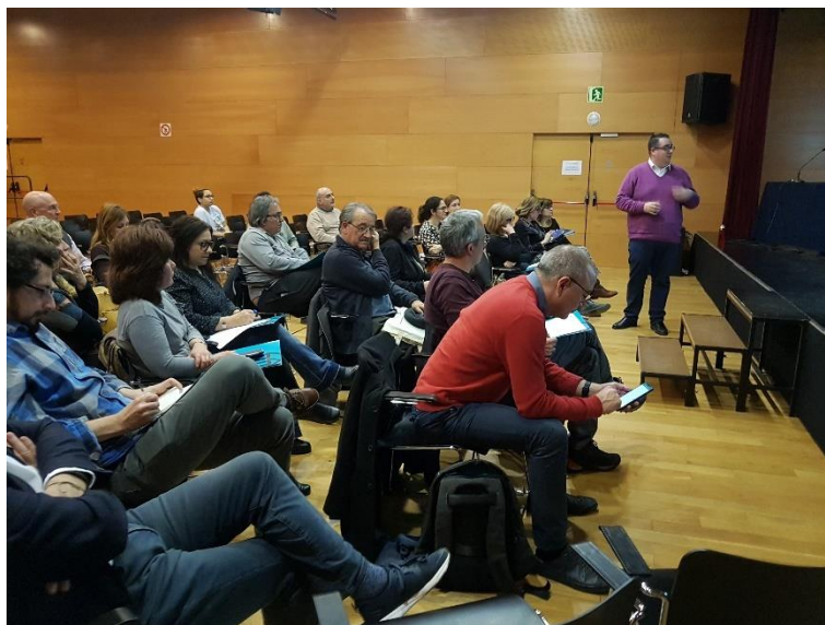
Posada en comú, exposició dels següents passos i tancament de la sessió per part de Cristian Alcázar, segon tinent d'alcalde de l'Hospitalet de Llobregat i regidor d'Espai Públic, Habitatge, Urbanisme i Sostenibilitat.

La Taula serà un espai participatiu emmarcat en el Consell de Ciutat, i per tant s'integrarà en l'estructura de governança de la ciutat, per tal que l'Ajuntament pugui rendir comptes dels avenços i l'acompliment dels compromisos adquirits en la lluita contra el canvi climàtic.