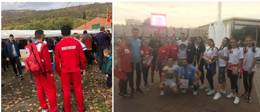
(aktivnosti omladine Crvenog krsta)

Tokom 2019. godine uspješno smo realizovali sve planirane programske aktivnosti i doprinijeli boljoj promociji organizacije, ali i humanih vrijednosti. Neke od aktivnosti u kojima su volonteri učestvovali su: