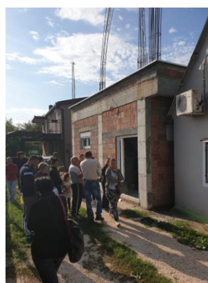
(sa distribucija humanitarne pomoći)

Pored navedenih, u okviru socijalne djelatnosti, realizovane su sljedeće aktivnosti: edukacije volontera, sastanci sa predstavnicima relevantnih institucija, izrada i distribucija informativno-edukativnog materijala, organizovanje edukativnih radionica, socijalnih aktivnosti i mnoge druge. Psiho-socijalna podrška pruža se podjednako svim tretiranim grupama i značajan je segment socijalne djelatnosti.