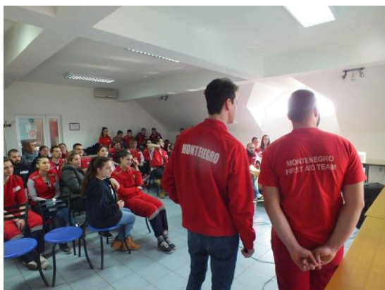
(sa jednog od seminara)

U skladu sa svojom misijom, Opštinska organizacija Crvenog krsta Danilovgrad ima intenzivnu saradnju sa više Organizacija iz Srbije Bosne i Hercegovine kao i Makedonije.