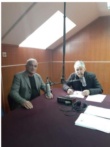
(gostovanje na radiu DG)