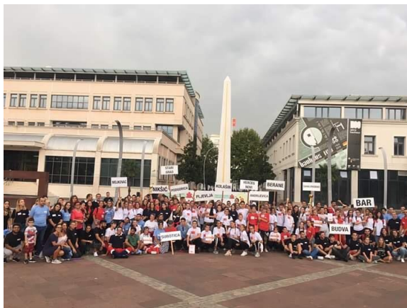
(Državno takmičenje Ekipa Prve pomoći-Podgorica 2019)

Crveni krst Crne Gore je organizovao 47. Državno takmičenje ekipa Crvenog krsta Crne Gore u pružanju prve pomoći, koje je održano u Podgorici.