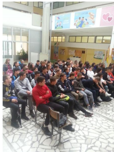
(predavanja na temu Difuzije)