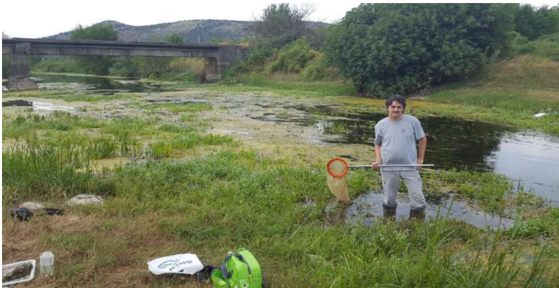
Uzorkovanje na Komanskom mostu, rijeka Sitnica.