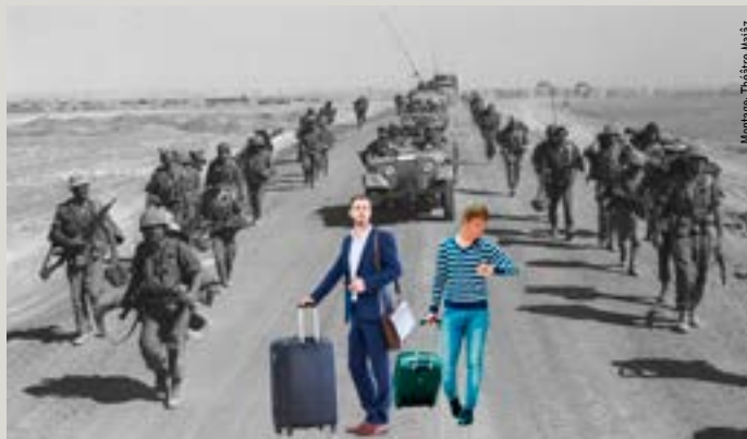
Montage: Théâtre Majáz

Zwei israelischen Regisseure machen im Rahmen ihrer internationalen Theaterarbeit dieselbe Erfahrung: Überall betrachtet man sie als „den Israeli“. Zwischen Politik, Moral, Geschichte und Realität – was ist eigentlich eine israelische Geschichte und könnten sie sie überhaupt vertreten, den vielen Fragen begegnen? Sie entschließen sich, die angsteinflößende Mission anzugehen: Ein Theaterstück über Ihre neurotische, halb verrückte und immer totalitärer werdende, aber dennoch geliebte Heimat anzubieten. Da überholt die Realität jede irre Fiktion, als mitten während ihrer Vorbereitungen am 7. Oktober der Krieg ausbricht und alles, was sie über das Leben in Israel / Palästina zu wissen glauben, auf den Kopf stellt.