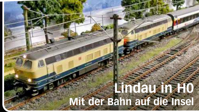
Lindau in H0 Mit der Bahn auf die Insel

200 Jahre Eisenbahn: So feierte man in Großbritannien