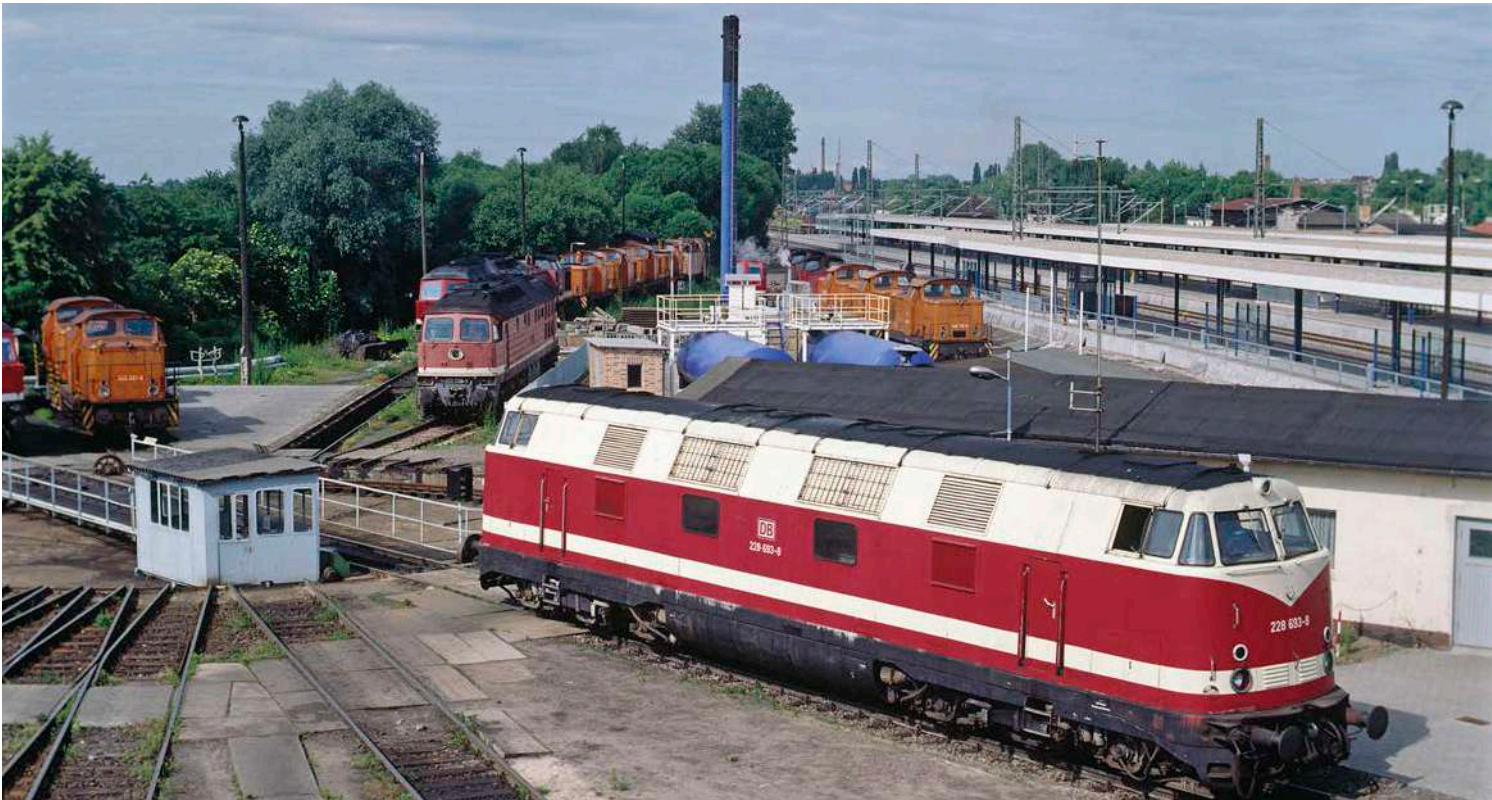
Als 228 692 am 2. Juli 1995 zu einer Sonderleistung die Est Brandenburg verließ, hatte die Baureihe 228.6-8 im Plandienst ihre Schuldigkeit getan. Am 28. August 1995 beendete die Maschine mit 228 804 die Geschichte der Baureihe 118 in Brandenburg.