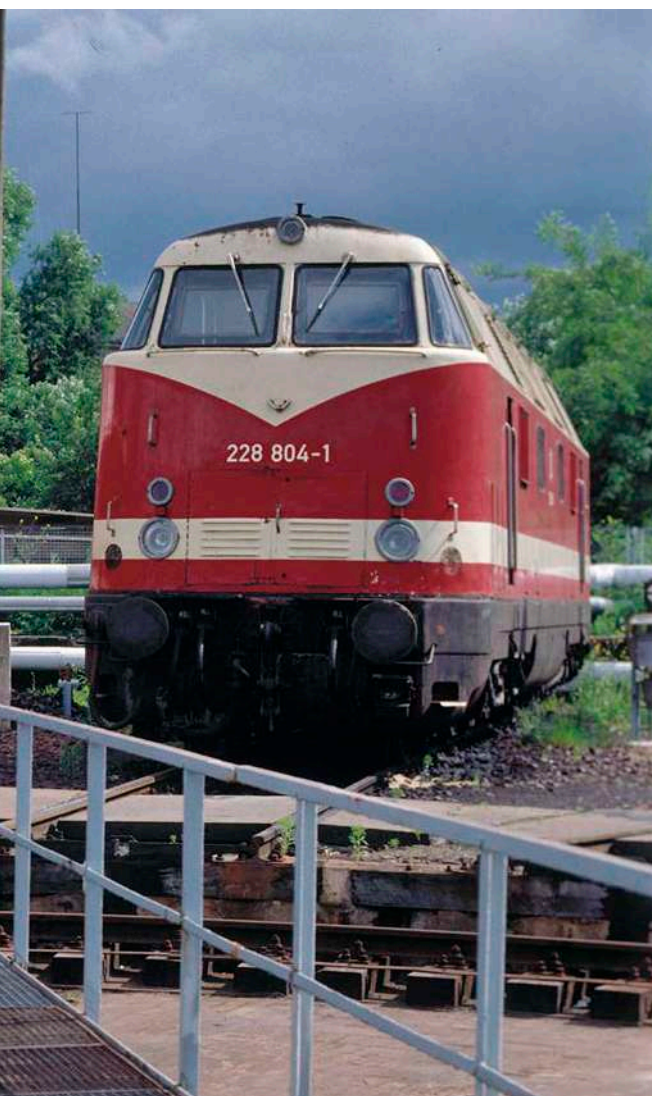
Am 2. Juli 1994 warteten 228 693, 228 372 und 228 804 (v. l.) an der Drehscheibe des ehemaligen Bw Brandenburg auf ihre nächsten Einsätze.