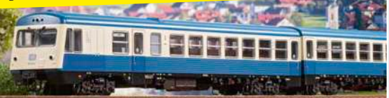
628-Urahn in H0 von Liliput