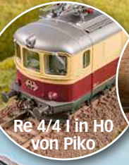
Re 4/4 I in H0 von Piko