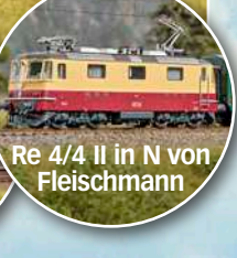
Re 4/4 II in N von Fleischmann