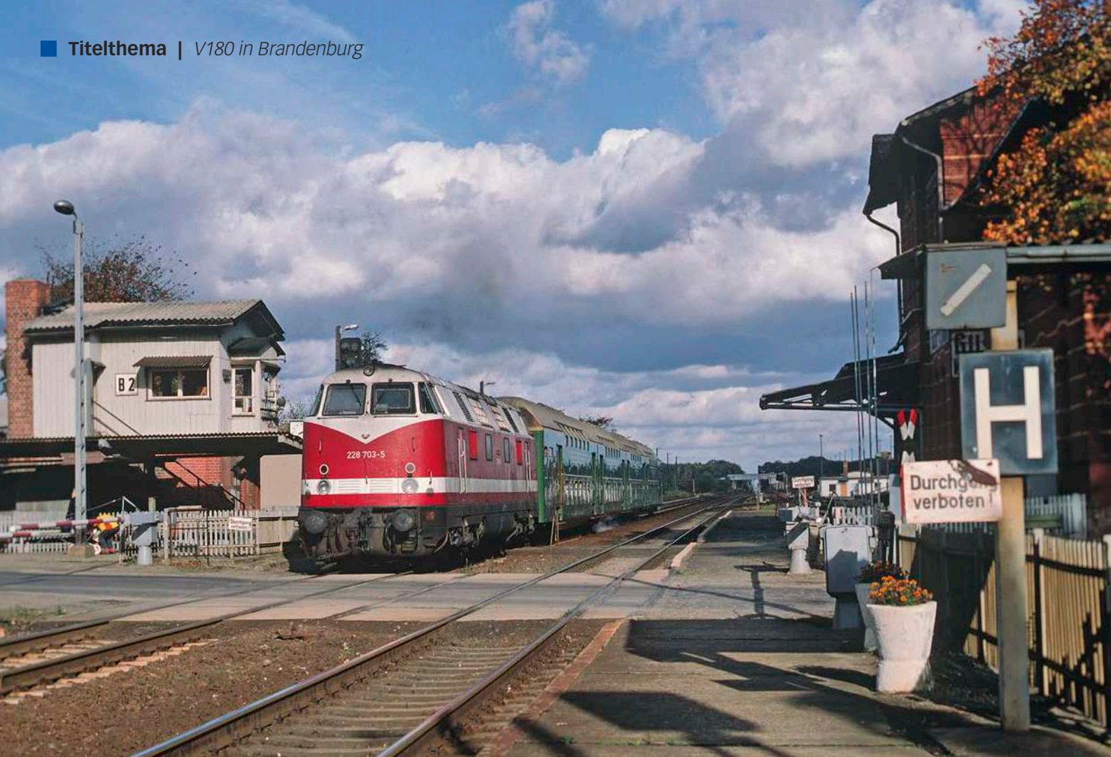
228 703 verließ im Herbst 1993 mit dem N7624 den Bahnhof Güsen. Mit der 1994 beginnenden Elektrifizierung veränderte die Magistrale ihr Aussehen grundlegend.