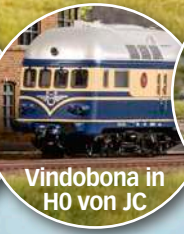
Vindobona in H0 von JC