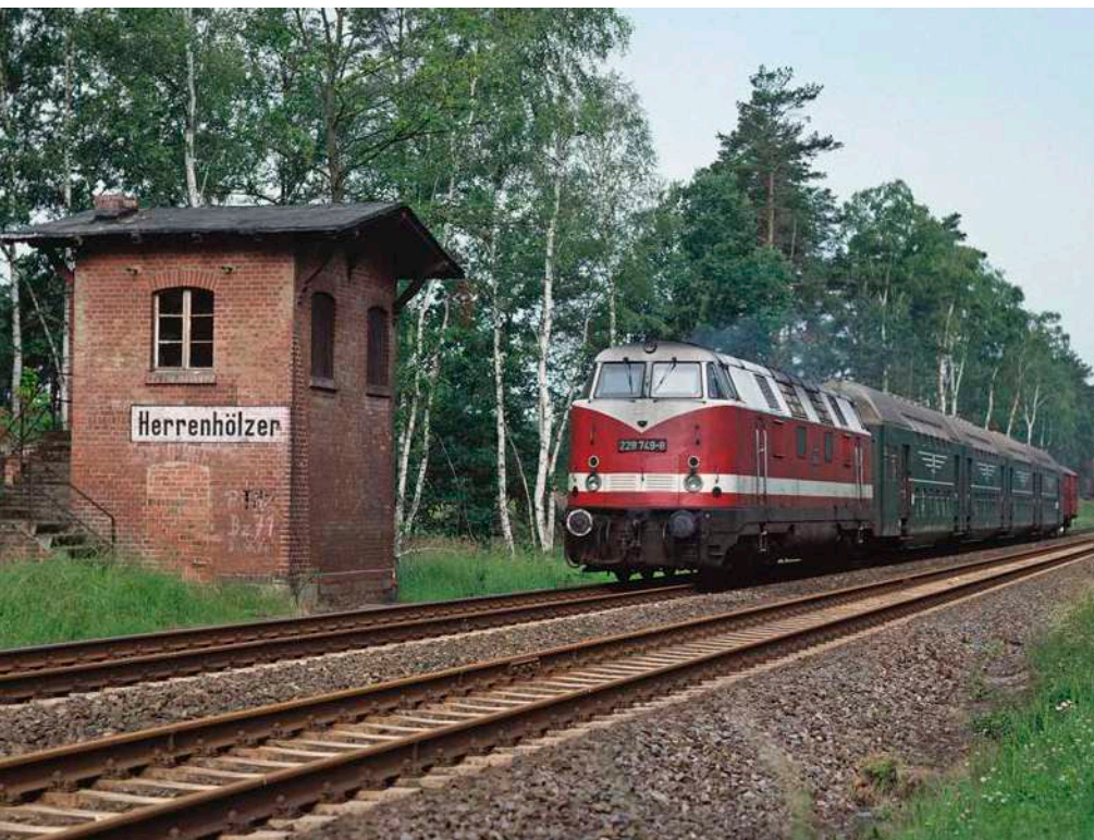
Typisch für die Magistrale waren die zahlreichen Blockstellen. Am 16. Juni 1993 pasierte 228 749 mit dem N7697 nach Brandenburg den einstigen Block Herrenhölzer.

übernahm das Bw Brandenburg mit 118 639 seine erste eigene Maschine. Bis zum Fahrplanwechsel am 27. September 1981 trafen außerdem 118 008, 039, 060, 554 und 715 ein, für welche die Abteilung Triebfahrzeug-Betrieb (Tb) einen dreitägigen Dienstplan aufstellte. Dieser sah in erster Linie Güterzüge in Richtung Magdeburg vor, da die vierachsigen Maschinen (Baureihen 118.0, 118.1 und 118.5) nicht freizügig auf der Städtebahn eingesetzt werden konnten. Die Achsfahrmasse der B'B'-Maschinen war mit bis zu