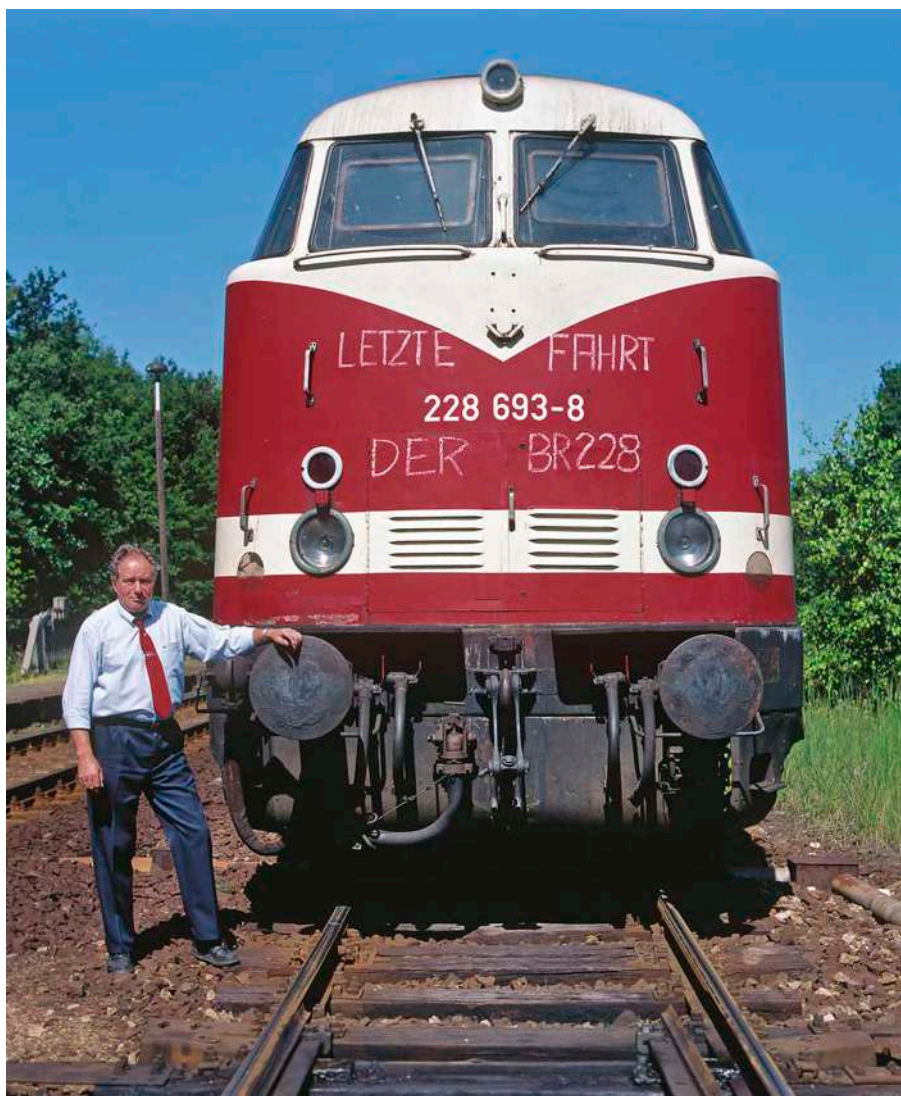
228 693 beendete am 27. Mai 1995 den Einsatz der Baureihe 228.6-8 auf der Städtebahn. In Döbberitz entstand ein Erinnerungsbild mit Lokführer Heinrich Kröger.