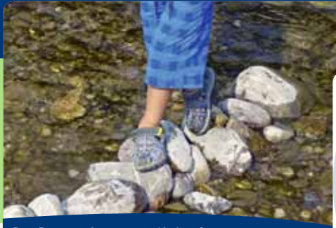
[56] Psychomotorik in der Natur