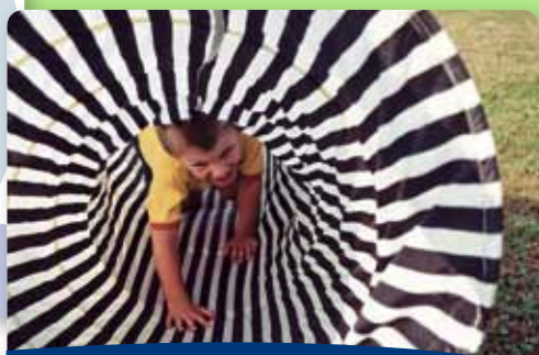
[74] Kreativität und Psychomotorik