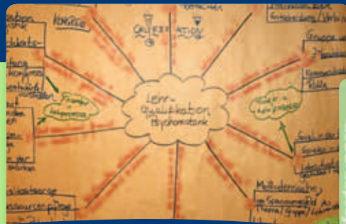
[127] Auf dem Weg zur psychomotorischen Lehre