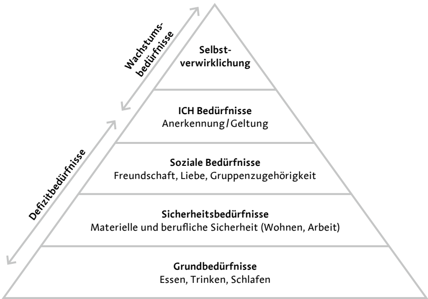
Abb. 1.3: Bedürfnispyramide orientiert an Maslow (2010)