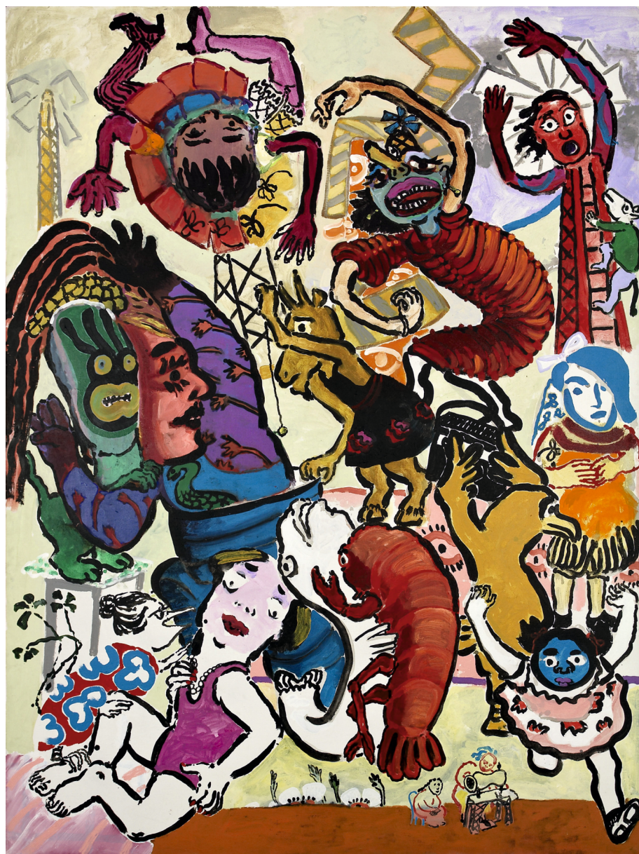
Paula Rego, The Vivian Girls as Windmills | As Vivian Girls como Moinhos de Vento , 1984