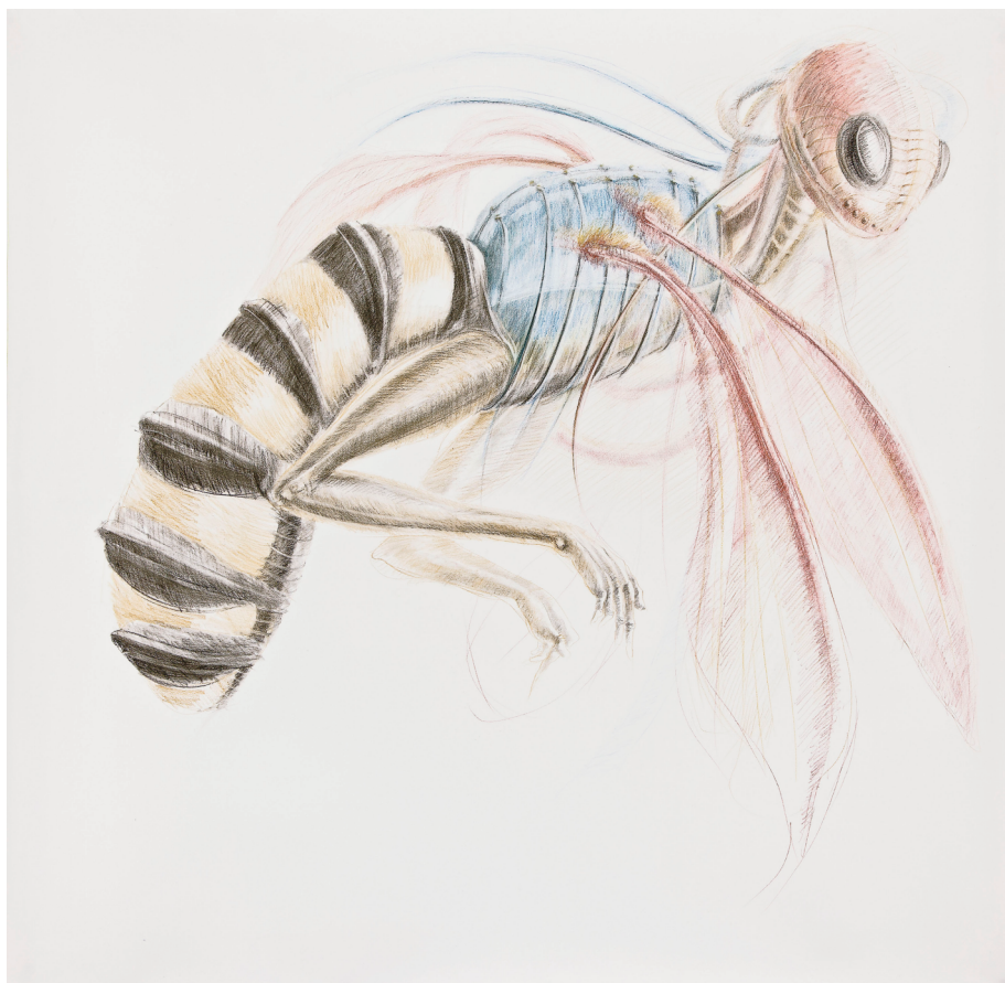
Jorge Castanho, Sem título | Untitled, 2014 Col. do Artista | Artist collection

uma mulher grávida, um casal, um berço. As respostas foram esclarecidas, sem embaraço nem vergonha. Nenhum riso indecoroso veio perturbá-las – salvo, justamente, da parte, de um público adulto bem mais infantil do que as próprias crianças e ao qual, Wolke repreendeu severamente.» 1