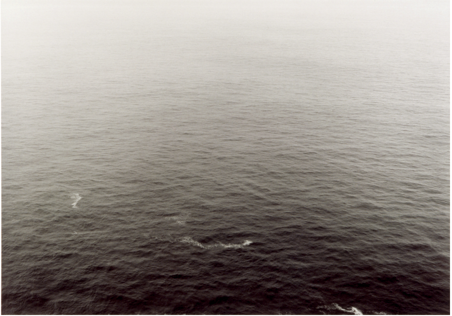
Thomas Joshua Cooper, Cabo de São Vicente (6 a.m.) | São Vicente Cape ( 6 a.m.), 1994