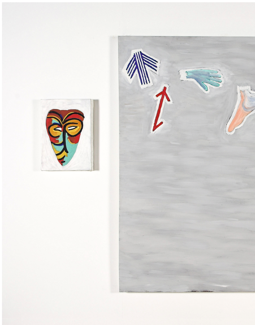
Leonel Moura, África - I - II - Saca Rabos (Bicho Empalhado) , 1982