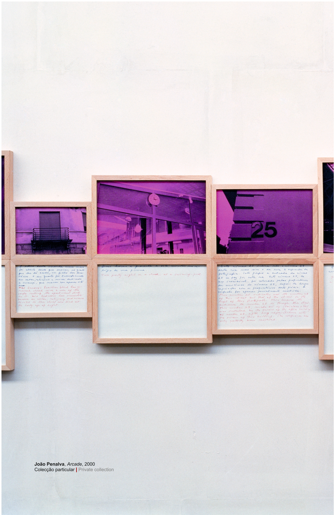
João Penalva, Arcade , 2000 Coleção particular | Private collection