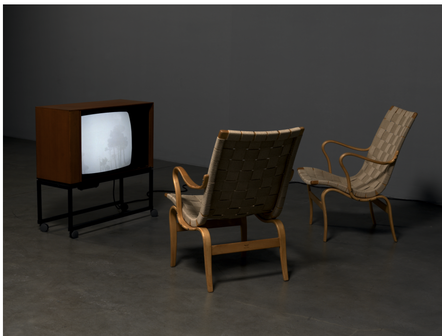
João Penalva, Dokumentarfilm (Doshi, 12. April 2003, 13.34 Uhr) , 2004 Colecção | Collection CAM – Fundação Calouste Gulbenkian

Esta pulsão para a escrita será aprofundada e radicalizada nos trabalhos seguintes em vídeo.