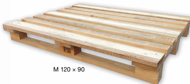
M 120 × 90

Kupující má právo vrátit nebo vyměnit (při další dodávce na započtení ceny palet této dodávky) prodávajícímu palety stejného druhu, nepoškozené a k dalším expedicím použitelné, a to do 6 měsíců ode dne dodávky, pokud není smluvně stanoveno jinak. Podmínkou pro zpětný výkup/odběr palet je jejich bezvadný stav v souladu s požadavky norem UIC435 – 2 a ČSN 269110, případně také s technickou dokumentací palet PRESBETON. Při vracení palet je nutné předložit doklady (uvést čísla dodacího listu, faktury, případně daňového dokladu), ke kterým se dané obaly vztahují. Bez těchto údajů nelze palety odkoupit/převzít od kupujícího zpět. Palety stejného druhu lze prodávajícímu odkoupit/předat jen v místě původní dodávky, pokud není smluvně stanoveno jinak. Dodání palet je považováno za zdanitelné plnění, k uvedeným cenám palet bude