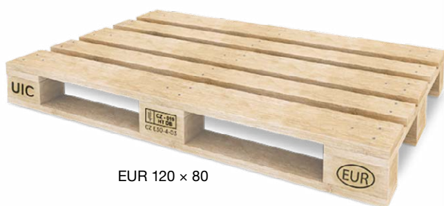
EUR 120 × 80

Do vyčerpání paletového konta, které množstvím či stářím náleží k dodávkám realizovaným dle ceníku platného od 4. 1. 2021 do 30. 6. 2021, bude výkup realizován za podmínek platných v době vyskladnění palety (200 Kč/ks bez DPH / 242 Kč/ks s DPH).