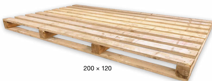
200 × 120

Do vyčerpání paletového konta, které množstvím či stářím náleží k dodávkám realizovaným dle ceníku platného od 4. 1. 2021 do 30. 6. 2021, bude výkup realizován za podmínek platných v době vyskladnění palety (200 Kč/ks bez DPH / 242 Kč/ks s DPH).