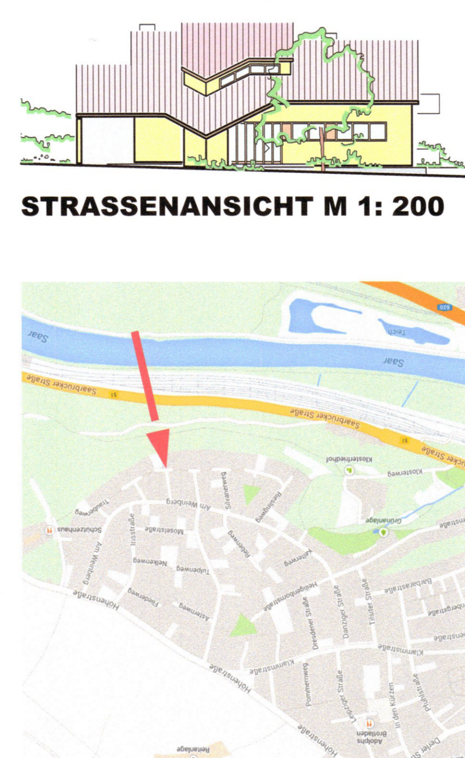
STRASSENANSICHT M 1: 200