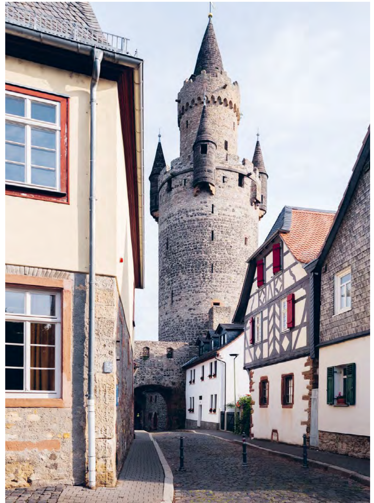
Blick auf den Adolfsturm