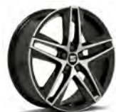
18 inch Performance Piano Black (PUK)