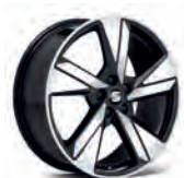
18 inch Diamond Cut (6F0CON498 8Z8)