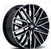
17 inch Diamond Cut (6F0CON497 8Z8)