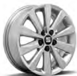
15 inch Enjoy Brilliant Silver (PJE)