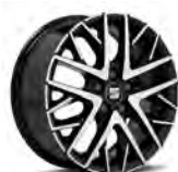
16 inch lichtmetalen velgen, Design (Piano Black) (PJQ)