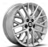
16 inch Design Brilliant Silver (PJN)