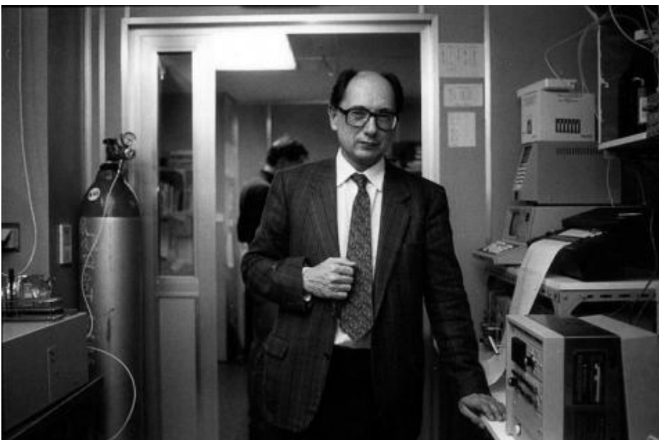
Gentse biotech-pionier Marc Van Montagu aan het werk in zijn laboratorium (Collectie Universiteitsarchief Gent, © Willy Dee, geraadpleegd via https://www.ugentmemorie.be/personen/van-montagu-marc-1933 ).

De impasse in de commercialisering van ggo's in de EU staat in schril contrast met het initieel enthousiasme dat voortvloeide uit de snelle en succesvolle ontwikkeling van de wetenschap achter genetische modificatie in de tweede helft van de twintigste eeuw. Een eerste impuls werd gegeven nadat onderzoekers in 1953 voor het eerst de structuur van DNA ontrafelden en zo een revolutie binnen de genetica ontketenden. 2 Plantenveredeling en genetische selectie gaan evenwel veel langer terug dan deze ontdekking: landbouwers en onderzoekers slagen er al millennia lang in om gewassen te veredelen door eigenschappen van verschillende gewassen te combineren. Tot de late jaren zeventig was deze veredeling steeds afhankelijk van geslachtelijke voortplanting, waardoor het een tijdje duurde voordat een bepaalde variëteit de gewenste kenmerken van een andere variëteit kon overnemen. Aan de hand van de nieuwe recombinant-DNA technologie (rDNA), waarbij DNA-fragmenten als het ware geknipt en geplakt konden worden, werd het echter ook mogelijk om DNA uit te wisselen zonder deze tijdsintensieve kruisingen. Deze nieuwe methode werd 'genetische modificatie' genoemd, maar tegenstanders van de technologie zouden al snel de pejoratieve term 'genetische manipulatie' vooropstellen.