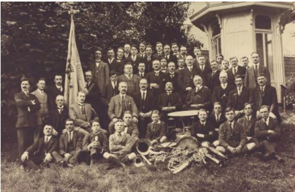
Groepsfoto van de Fanfare Sint-Cecilia uit Harelbeke (met instrumenten en vlag), 1919.

In onze streken ontstonden harmonieën vanaf het einde van de achttiende eeuw. Deze amateurmuziekverenigingen waren in hun beginperiode vooral gericht op een stedelijk en burgerlijk publiek. Vanaf ongeveer 1850 kregen de harmonieën, bestaande uit koper- en houtblazers, gezelschap van fanfares, die enkel uit koperblazers bestonden. Het aantal muziekverenigingen nam sterk toe tijdens de tweede helft van de negentiende eeuw, wat vooral te wijten was aan de explosieve groei van het aantal fanfares. Tegelijkertijd vond ook een democratisering en een verspreiding naar het platteland plaats.