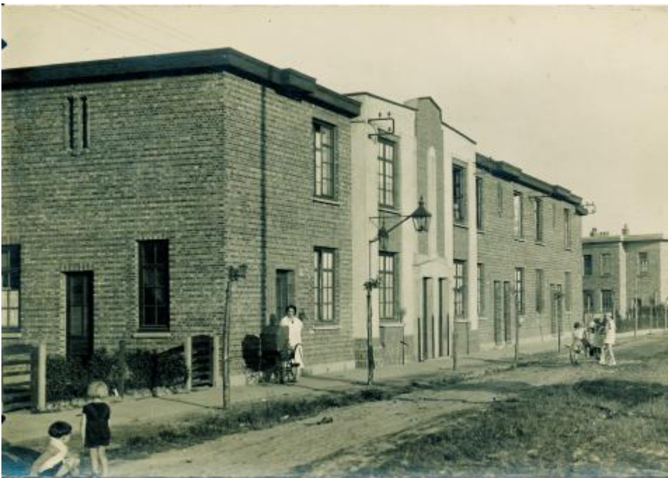
Tuinwijk Eenheid in Wilrijk, z.d. (collectie Amsab-ISG).

De Socialistische Gebuurtekring Eenheid werd in 1924 opgericht door bewoners van de Wilrijkse tuinwijk Eenheid. Ze ontwikkelde een intens gemeenschapsleven, met tal van activiteiten zoals toneelstukken, bloemenmarkten, kaartavonden en feesten. Er werden ook een vrouwengroep, een kindergroep en een clubhuis voor de jeugd (De Fakkel) opgericht. Daarnaast speelde de kring een belangrijke rol als tussenschakel in de contacten met de Huurderscoöperatie Eenheid.