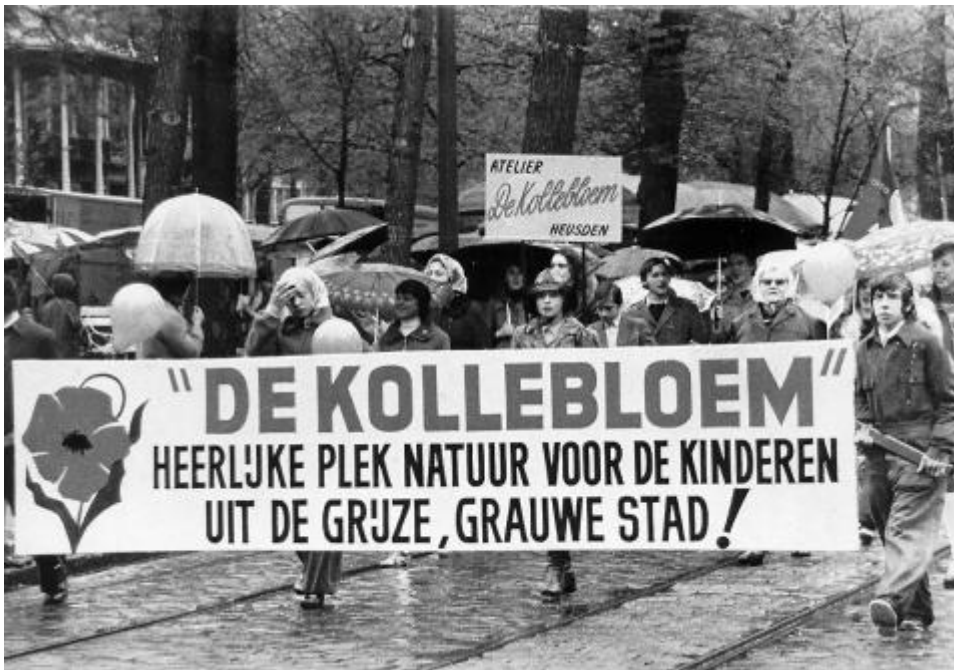
Optocht van De Kollebloem, 1973.