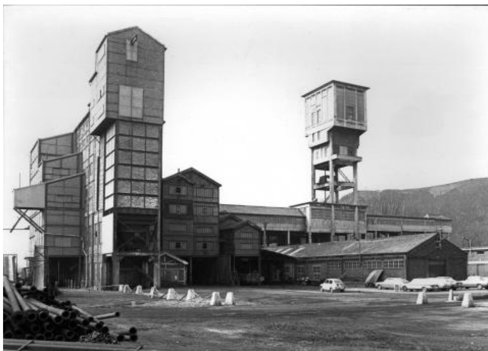
Vue du charbonnage d'Argenteau, alors en exploitation, dans les années 1970.

Le Centre liégeois d'archives et de documentation de l'industrie charbonnière (CLADIC) , dépendant de Blegny-Mine, vient de boucler l'inventaire des archives de la Société anonyme des charbonnages d'Argenteau. Cette compagnie charbonnière, fondée à Bruxelles en 1919, a exploité jusqu'au 31 mars 1980 la concession de mines de houille d'Argenteau-Trembleur qui s'étendait au nord-est de Liège sous les anciennes communes d'Argenteau, Cheratte, Feneur, Mortier, Mortier (enclave), Saint-Remy et Trembleur. L'exploitation était menée à partir du siège Marie, site qui deviendra Blegny-Mine après la fermeture. Il s'agit du dernier charbonnage du bassin de Liège à avoir fermé ses portes.