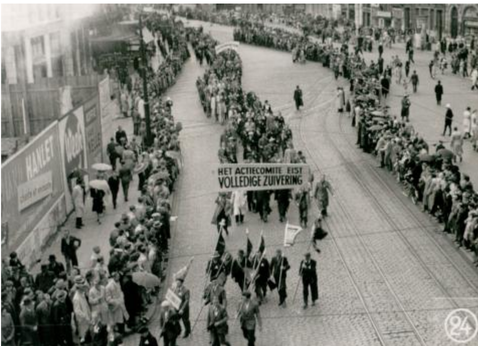
Foto van een betoging in Antwerpen georganiseerd door het Actiecomité van verenigde weerstandsgroeperingen voor een strengere repressie, 1947.

De voornaamste taak bestond erin gemeenrechtelijke misdrijven op te sporen en bewijzen te verzamelen in opdracht van de procureur des Konings of de onderzoeksrechter. De gerechtelijke politie verrichtte onderzoek naar: moord en doodslag, brandstichting, brandkastkraken, opzienbarende kunstdiefstallen, zoals de diefstal van het paneel van De rechtvaardige rechters van het Lam Gods, illegale gokwedstrijden en kansspelen, fraude en oplichting, uitgifte van valse bankbiljetten, verdachte overlijdens enz. In de inventaris van de GPP Gent zijn de onderzoeksdossiers aanwezig die over deze zaken zijn aangelegd.