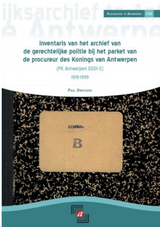
Inventaris van het archief van de gerechtelijke politie Antwerpen

De inventarissen van Antwerpen en Gent kunnen aangekocht worden in het Rijksarchief te Antwerpen-Beveren, het Rijksarchief te Gent en in de archiefwinkel van het Algemeen Rijksarchief. Je kan de (papieren) inventaris ook bestellen via publicat@arch.be , gratis downloaden in pdf-formaat via de webshop of gratis raadplegen via de zoekrobot.