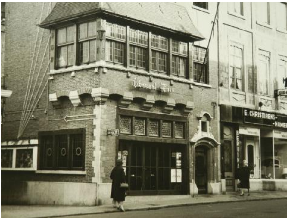
Foto van het Liberaal Huis in Tienen, s.d..

Vanaf het einde van de negentiende eeuw zag men in Vlaanderen en België, verspreid over het land, zogenaamde Liberale Huizen opduiken. Deze lokale organisaties beheerden één of meerdere gebouwen die onderdak boden aan en/of gebruikt werden door de plaatselijke liberale verenigingen. Meestal gebeurde dit onder de structuur van een Samenwerkende Maatschappij (SM)/Coöperatieve Vennootschap (CV), NV of vzw. Hoewel minder talrijk dan hun katholieke en socialistische tegenhangers (wat toegeschreven wordt aan het feit dat liberale verenigingen gemakkelijker terecht konden in de lokalen van liberale caféhouders en aan de weerstand van liberale burgers en middenstanders t.o.v. coöperaties 1 , kan men toch van een uitgebreid netwerk spreken. Enkele van deze Liberale Huizen zijn nog steeds actief.