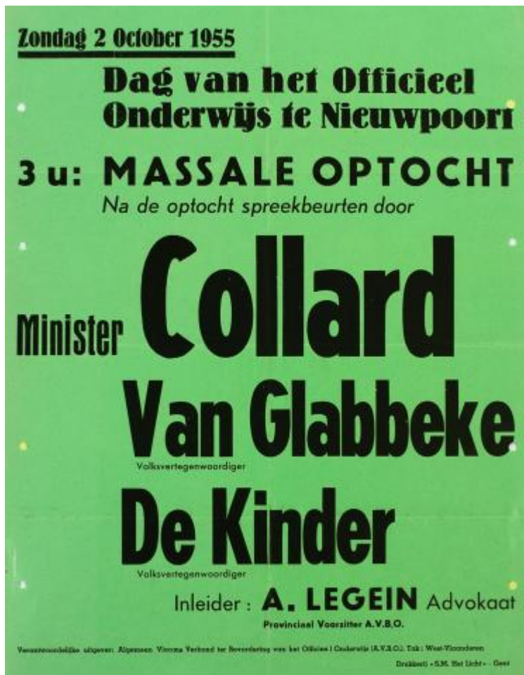
Affiche voor de Dag van het Officieel Onderwijs te Nieuwpoort op 2.10.1955.