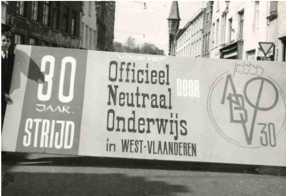
Beeld uit de optocht n.a.v. de viering van 30 jaar AVBO te Brugge op 18 mei 1963 (Liberaal Archief/Liberas, Archief AVBO West-Vlaanderen, 4.8).

De beweging werd gekenmerkt door een constructieve houding: eerder dan alle pijlen te richten tegen de subsidiëring van het vrij confessioneel onderwijs, werd met succes het door de katholieken gehuldigde principe van de ‘vrije keuze van de huisvader’ gebruikt om te strijden voor een groter aanbod van officiële lagere en middelbare scholen. Het programma van de Vrienden van het Officieel Onderwijs had dan ook een duidelijke impact op de schoolwetten van 1937.