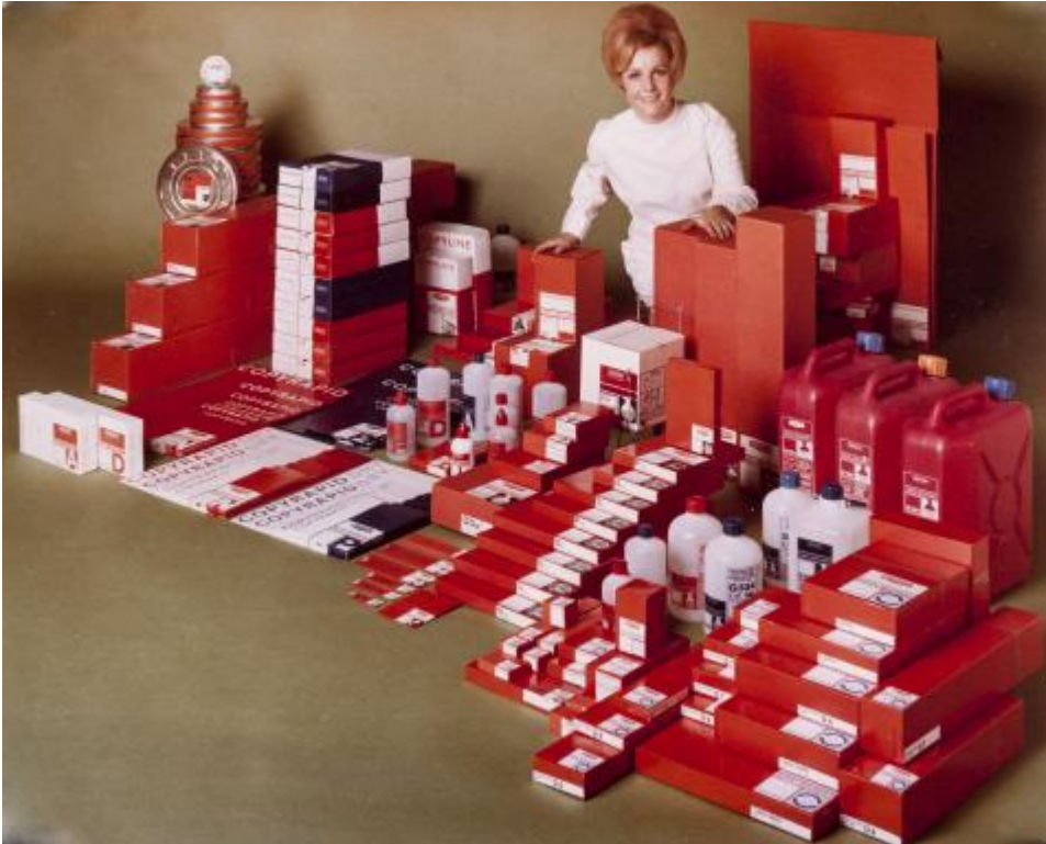
Anoniem, Overzicht van het Gevaert assortiment, kort na de fusie in 1964, 1965-1966 (Deelcollectie Gevaert iconografie).