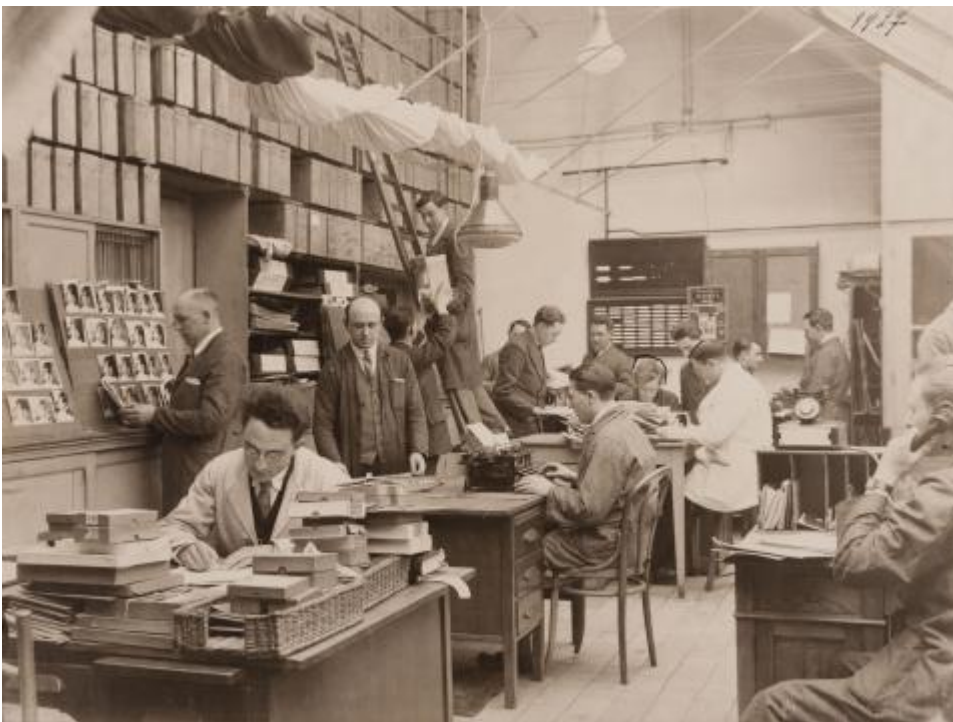
Anoniem, De afdeling 'Fotokontrol' was belast met de keuring van het gefabriceerde fotopapier, 1927 (D-klassement).

In het buitenland was de vraag naar het fotopapier van Gevaert eveneens groot, zodat het bedrijf er filialen kon openen. Samen met het succes groeide het aantal innovatieve papiersoorten en nieuwe producten. Na de Eerste Wereldoorlog bleef het bedrijf spectaculair uitbreiden: zo zag in 1920 de dochtervennootschap Gevaert Company of America het levenslicht en werd de firma omgevormd tot de NV Gevaert Photo-Producten. Na de overlevingsperiode die de Tweede Wereldoorlog inhield, stonden de jaren 1950 vooral in het teken van automatisering en verbreding van de doelgroep: het bedrijf richtte zich voortaan ook op de vakman en de professionele sector, zoals medische organisaties. Omdat de concurrentie met internationale spelers als Kodak, Agfa, Fuji en Ilford groot was, hield Gevaert zich vanaf dat decennium ook intens met marketing en corporate identity bezig, met een focus op de buitenlandse markt.