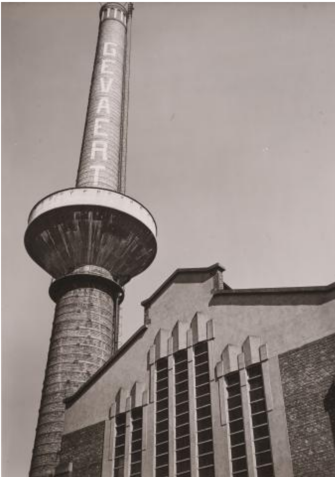
Anoniem, Zicht op de 'Grote Schouw', het herkenningsteken van Gevaert op de site in Mortsel, 1928 (Deelcollectie Gevaert iconografie).

In 2017 tekenden het FOMU – Fotomuseum Antwerpen en Agfa nv het contract van de overdracht van de historische collectie Agfa-Gevaert aan het FOMU. Aanleiding daartoe was de beslissing in 2015 van Agfa nv om de deuren van het Varenthof in Mortsel, waar de collectie zich al sinds 1988 bevond, te sluiten. Een herbestemmings- en waarderingstraject voor de historische collectie drong zich op, met als ambitie dit bijzondere stuk industrieel erfgoed in de beste omstandigheden te beheren en ontsluiten. 2