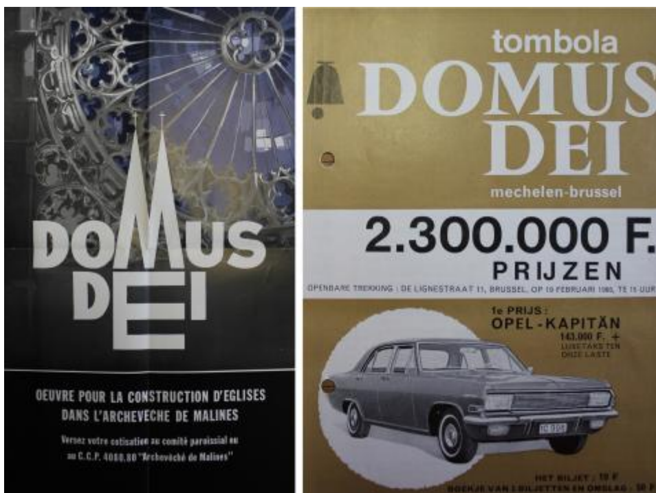
Promotiemateriaal voor Domus Dei (Aartsbisschoppelijk Archief te Mechelen, archief Domus Dei).

In de laatste decennia krijgen echter ook andere actoren in het kerkenbouwproces aandacht. Om de constructie van kerken te versnellen werden er in vele bisdommen in West-Europa raadgevende instanties opgericht vanaf de jaren 1950. Onderzoek naar de rol van deze diocesane organisaties is nog maar recent op gang gekomen. Deze organisaties waren belangrijk in de ontwikkeling van specifieke expertise en in de professionalisering van kerkenbouw. Voor België boog architectuurhistoricus Sven Sterken zich al over de invloed van het diocesaan werk Domus Dei , dat in 1953 werd opgericht in het Aartsbisdom en later ook in andere Belgische bisdommen. 16 Domus Dei verzag technisch, financieel en liturgisch advies aan kerkenbouwers, maar is vooral bekend van zijn geldinzamelacties. Het was een typisch voorbeeld van een instantie gericht op de professionalisering van de kerkenbouw. Op internationaal vlak werd er eerder al gewezen op het belang van de Franse theoreticus Gaston Bardet die een christelijke versie van de Amerikaanse ‘neighbourhood unit’ voorstelde. 17 De rol van anderen actoren, zoals het Centre de Recherche Socio-Religieuse dat zich in België eerder bezighield met de planning van religieuze infrastructuur, blijft echter nog onderbelicht.