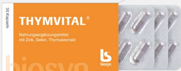
THYMVITAL®, 30 Kapseln

Zutaten: Thymusextrakt-Pulver vom Kalb (50 %); Füllstoff: mikrokristalline Cellulose; Überzugsmittel: Schellack; Rindergelatine (Kapselhülle); Zinkgluconat; Farbstoffe: E 171, E 555; Natriumselenit Pentahydrat.