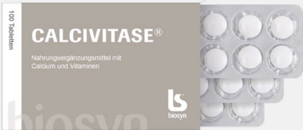
CALCIVITASE®, 100 Tabletten

Zutaten: Calciumcarbonat; Inulin; Rapsöl, gehärtet; Maisstärke; Füllstoff (vernetzte Carboxymethylcellulose); Überzugmittel: Hydroxypropylmethylcellulose; Vitamin D 3 (Colecalciferol); Vitamin K (Phylloquinon)