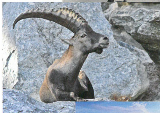
Steinbock am Briener Rothorn im Berner Oberland.