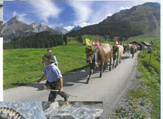
Zügeln mit Kühen bei Engelberg OW, im Hintergrund der Gipfel der Hahnen (links).