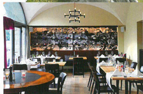
Das «Bellini» in Luzern.