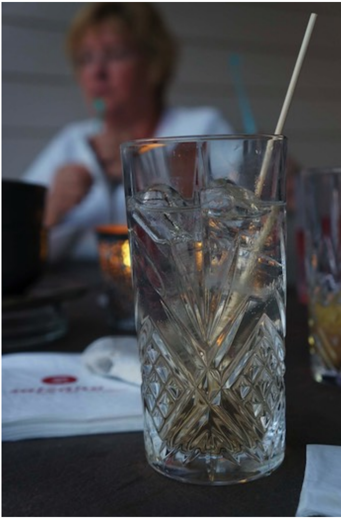
Sowohl bei den Drinks ...