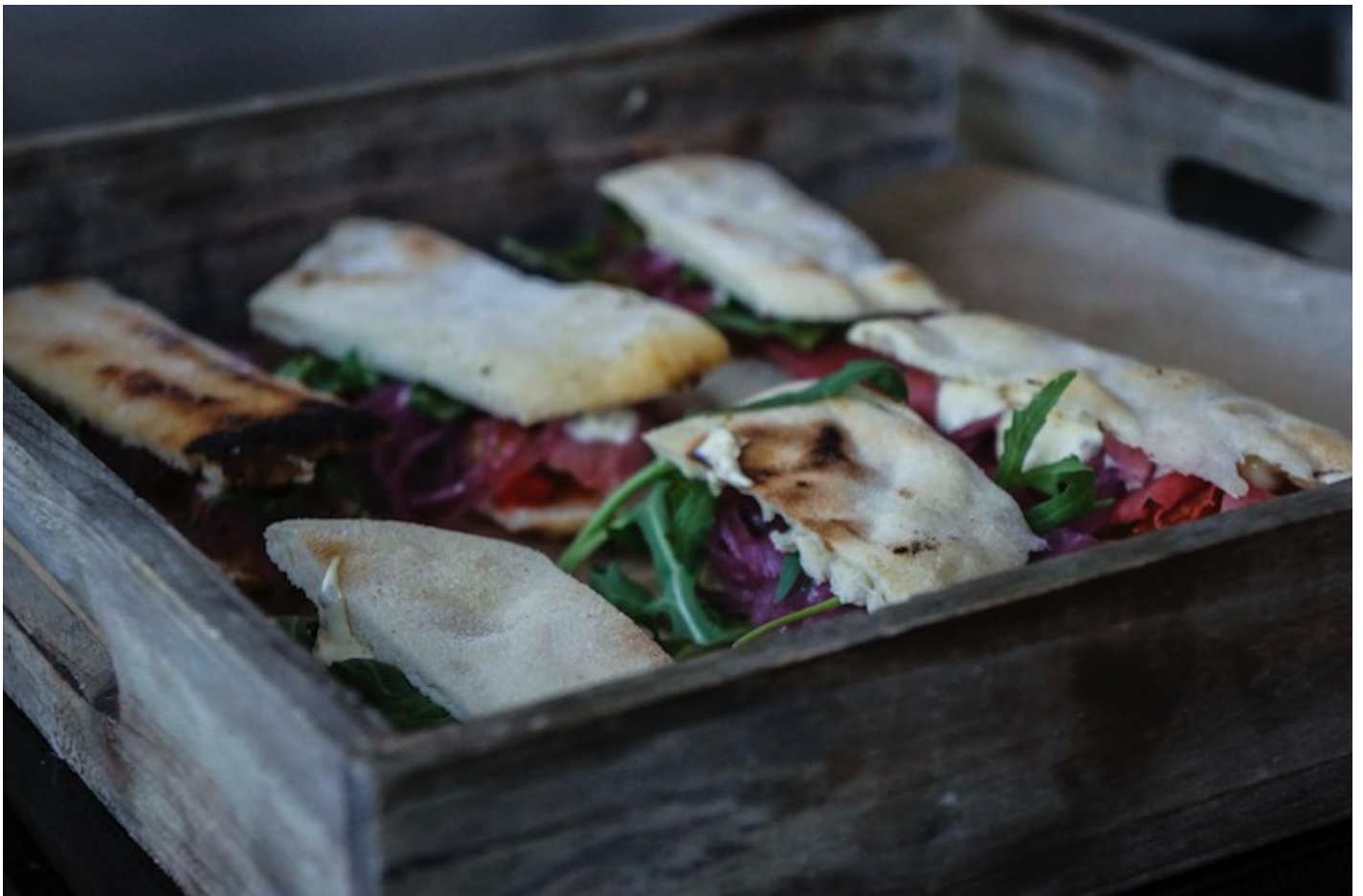
... und dem Fingerfood legen die Gastgeber Wert auf «authentisch, naturbelassen und unverfälscht».