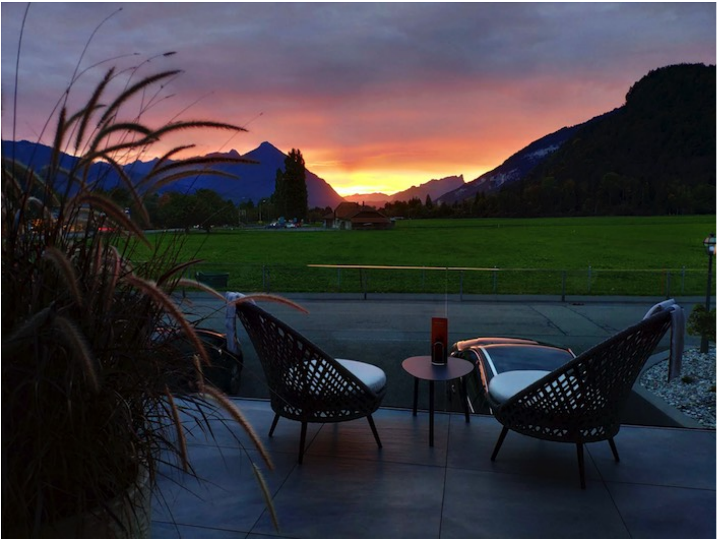
Die Salzano Sunset Lounge bietet freie Sicht für Romantiker und Sonnenanbeter.