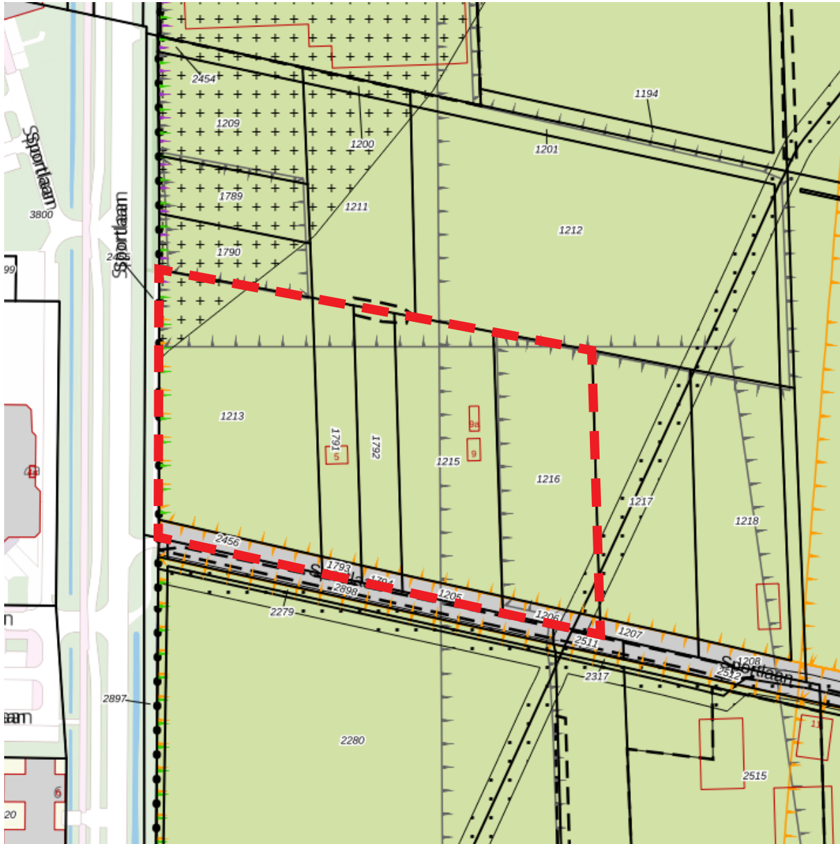
Bestemmingsplan Buitengebied, geconsolideerde versie 2019