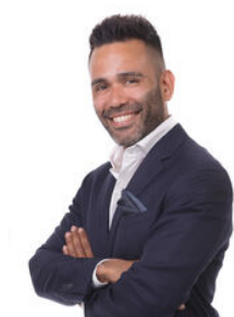
Cesar van Vliet Makelaar o.z.

Als lokale experts kennen wij de regio Leiden van binnen en buiten. U kunt bij ons terecht voor al uw vragen en advies met betrekking tot onroerend goed. Wij zijn een servicegerichte organisatie en ondersteunen u bij elke stap van het transactieproces. Van tips om uw huis verkoopklaar te maken tot aan het verzorgen van een naamplaatje voor de nieuwe eigenaar van uw woning. Onze beroemde slogan luidt: "Niemand in de wereld verkoopt meer onroerend goed dan RE/MAX." Laat ons u overtuigen.