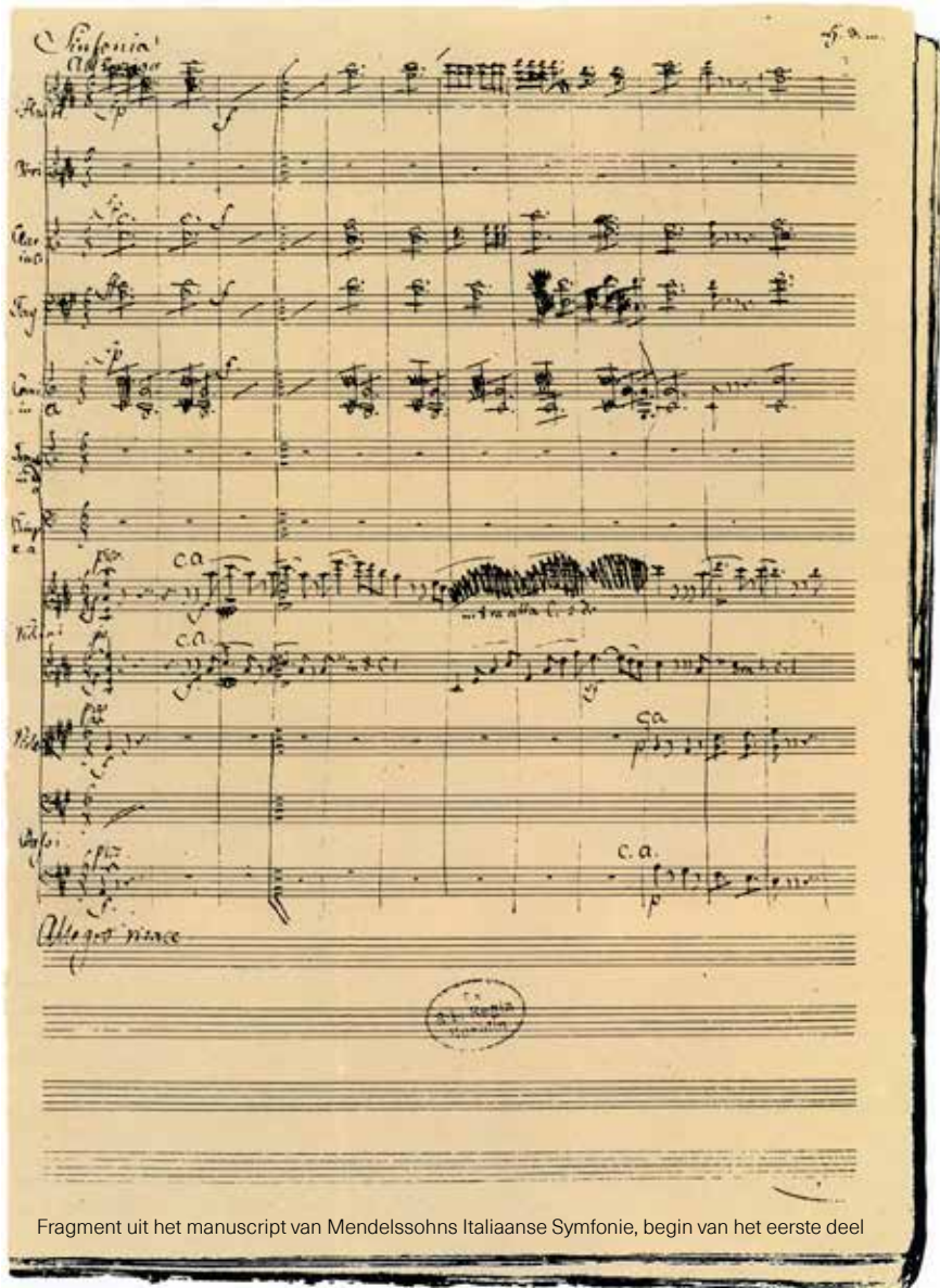
Fragment uit het manuscript van Mendelssohns Italiaanse Symfonie, begin van het eerste deel

“Hij speelde piano zoals een leeuwerik zweeft, hoog boven de wolken”, zo noteerde zijn goede vriend Ferdinand Hiller (1811-1885), in zijn boek ‘Felix Mendelssohn Bartholdy: Briefe und Erinnerungen’, Keulen 1874.