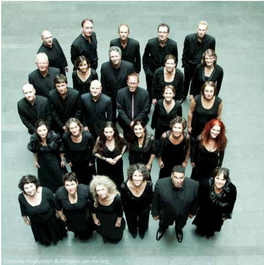
Cappella Amsterdam