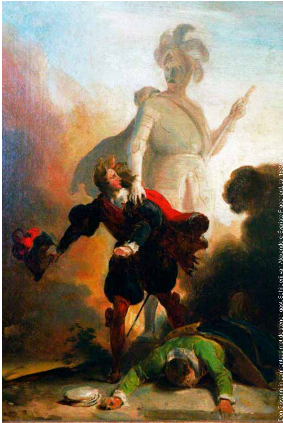
Don Giovanni in confrontatie met de stenen gast. Schilderij van Alexandre-Evariste Fragonard, ca. 1830-35